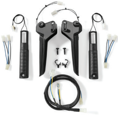
HANDTAGSVÄRME-SATS 599 42 39-01