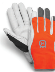
HANDSKE, CLASSIC LIGHT 596 31 06-06