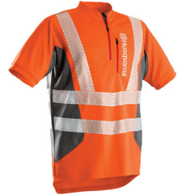
T-SHIRT TECHNICAL HIGH VIZ, KORT ÄRM EN 20471 501 72 05-66