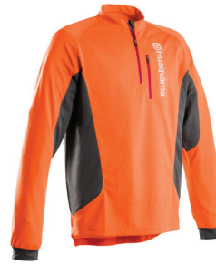
T-SHIRT TECHNICAL, LÅNG ÄRM 501 72 03-46