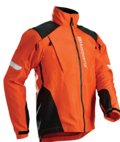
ARBETSJACKA TECHNICAL, TRIM & RÖJ 580 68 82-50