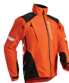
ARBETSJACKA TECHNICAL, TRIM & RÖJ 580 68 82-58