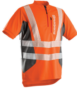
T-SHIRT TECHNICAL HIGH VIZ, KORT ÄRM EN 20471 501 72 05-58