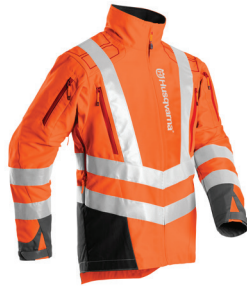
ARBETSJACKA TECHNICAL EN20471, TRIM & RÖJ 597 24 59-62