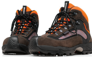
TRÄDGÅRDSKÄNGOR, TECHNICAL 596 30 64-40