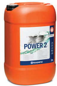
ALKYLATBENSIN XP POWER 2