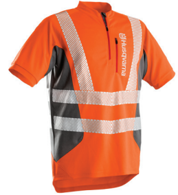
T-SHIRT TECHNICAL HIGH VIZ, KORT ÄRM EN 20471 501 72 05-50