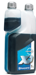
TVÅTAKTSOLJA, XP® SYNTHETIC