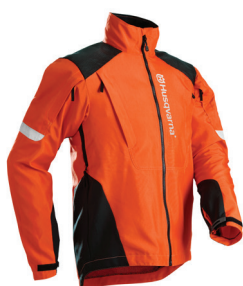
ARBETSJACKA TECHNICAL, TRIM & RÖJ 580 68 82-46