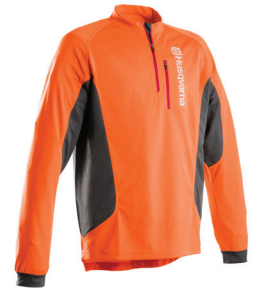
T-SHIRT TECHNICAL, LÅNG ÄRM 501 72 03-66