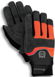
HANDSKE, TECHNICAL LIGHT 596 30 92-09