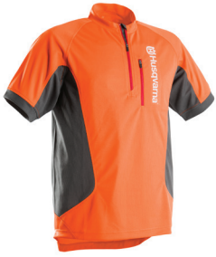
T-SHIRT TECHNICAL, KORT ÄRM 501 71 59-62