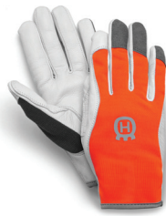
HANDSKE, CLASSIC LIGHT 596 31 06-10