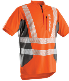
T-SHIRT TECHNICAL HIGH VIZ, KORT ÄRM EN 20471 501 72 05-46