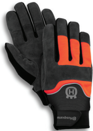
HANDSKE, TECHNICAL LIGHT 596 30 92-10