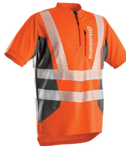
T-SHIRT TECHNICAL HIGH VIZ, KORT ÄRM EN 20471 596 30 39-54