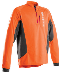
T-SHIRT TECHNICAL, LÅNG ÄRM 501 72 03-58