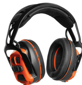
HÖRSELSKYDD X-COM R, BLUETOOTH 595 08 40-01