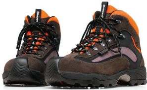
TRÄDGÅRDSKÄNGOR, TECHNICAL 596 30 64-38