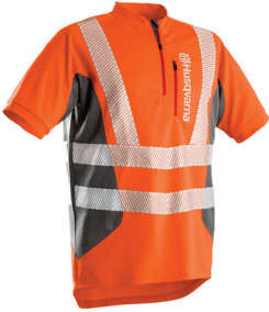
T-SHIRT TECHNICAL HIGH VIZ, KORT ÄRM EN 20471 501 72 05-54