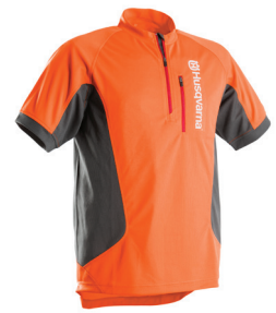
T-SHIRT TECHNICAL, KORT ÄRM 501 71 59-58