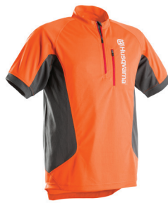
T-SHIRT TECHNICAL, KORT ÄRM 501 71 59-50