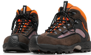
TRÄDGÅRDSKÄNGOR, TECHNICAL 596 30 64-39