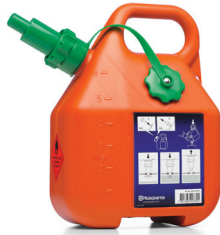
BENSINDUNK 6 LITER, ORANGE