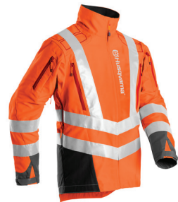
ARBETSJACKA TECHNICAL EN20471, TRIM & RÖJ 597 24 59-54