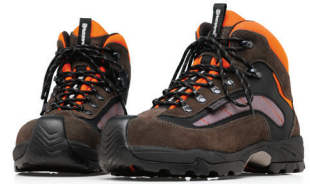
TRÄDGÅRDSKÄNGOR, TECHNICAL 596 30 64-37