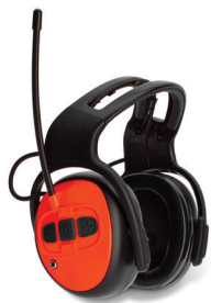
HÖRSELSKYDD MED FM-RADIO 578 27 49-03