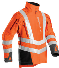
ARBETSJACKA TECHNICAL EN20471, TRIM & RÖJ 597 24 59-46