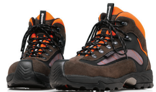
TRÄDGÅRDSKÄNGOR, TECHNICAL 596 30 64-45