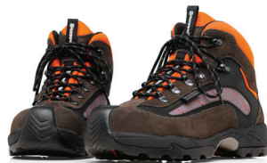
TRÄDGÅRDSKÄNGOR, TECHNICAL 596 30 64-43