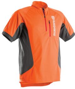
T-SHIRT TECHNICAL, KORT ÄRM 501 71 59-66