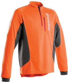
T-SHIRT TECHNICAL, LÅNG ÄRM 501 72 03-54