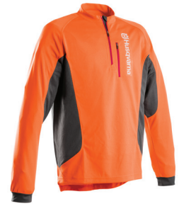
T-SHIRT TECHNICAL, LÅNG ÄRM 501 72 03-50