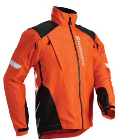
ARBETSJACKA TECHNICAL, TRIM & RÖJ 580 68 82-54