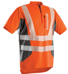
T-SHIRT TECHNICAL HIGH VIZ, KORT ÄRM EN 20471 596 30 39-58