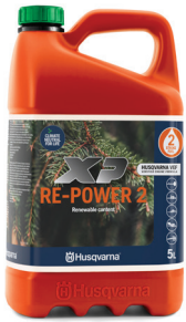
ALKYLATBENSIN XP® RE-POWER 2