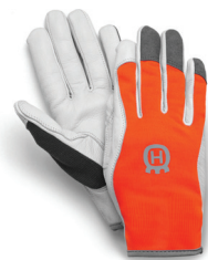
HANDSKE, CLASSIC LIGHT 596 31 06-07