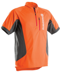
T-SHIRT TECHNICAL, KORT ÄRM 501 71 59-46