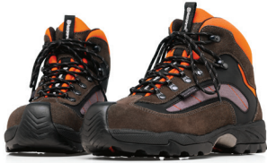
TRÄDGÅRDSKÄNGOR, TECHNICAL TRÄDGÅRDSKÄNGOR, TECHNICAL