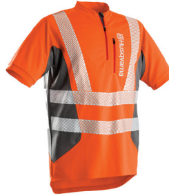
T-SHIRT TECHNICAL HIGH VIZ, KORT ÄRM EN 20471 501 72 05-62