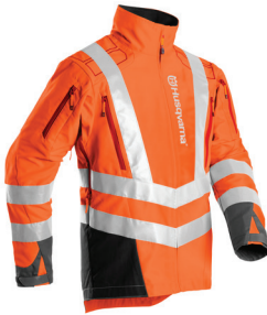
ARBETSJACKA TECHNICAL EN20471, TRIM & RÖJ 597 24 59-58