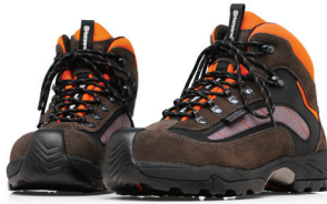
TRÄDGÅRDSKÄNGOR, TECHNICAL 596 30 64-36