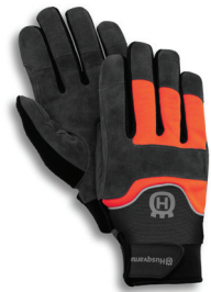
HANDSKE, TECHNICAL LIGHT 596 30 92-08