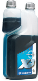
TVÅTAKTSOLJA, XP® SYNTHETIC 578 18 00-03