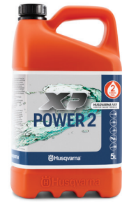
ALKYLATBENSIN XP POWER 2