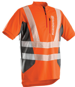
T-SHIRT TECHNICAL HIGH VIZ, KORT ÄRM EN 20471 596 30 39-50