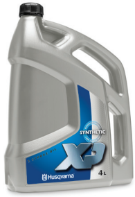
TVÅTAKTSOLJA, XP® SYNTHETIC 578 03 71-03