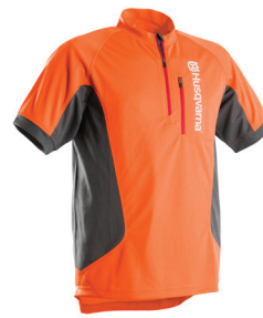
T-SHIRT TECHNICAL, KORT ÄRM 501 71 59-54