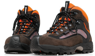
TRÄDGÅRDSKÄNGOR, TECHNICAL 596 30 64-41