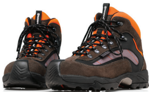
TRÄDGÅRDSKÄNGOR, TECHNICAL 596 30 64-42