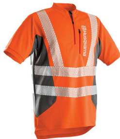
T-SHIRT TECHNICAL HIGH VIZ, KORT ÄRM EN 20471 596 30 39-66