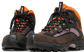
TRÄDGÅRDSKÄNGOR, TECHNICAL 596 30 64-44