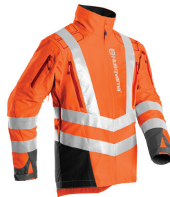
ARBETSJACKA TECHNICAL EN20471, TRIM & RÖJ 597 24 59-50