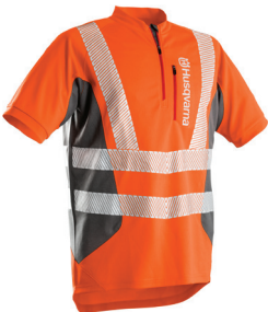
T-SHIRT TECHNICAL HIGH VIZ, KORT ÄRM EN 20471 596 30 39-62