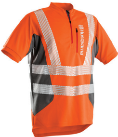
T-SHIRT TECHNICAL HIGH VIZ, KORT ÄRM EN 20471 596 30 39-46