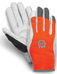
HANDSKE, CLASSIC LIGHT 596 31 06-08