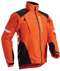
ARBETSJACKA TECHNICAL, TRIM & RÖJ 580 68 82-62