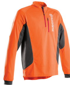
T-SHIRT TECHNICAL, LÅNG ÄRM 501 72 03-62