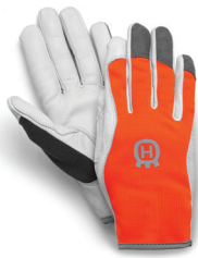
HANDSKE, CLASSIC LIGHT 596 31 06-09