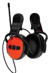
HÖRSELSKYDD MED FM-RADIO 578 27 49-04