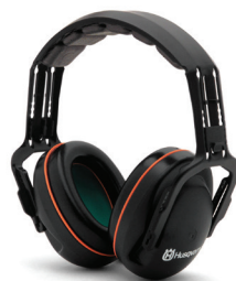
HÖRSELSKYDD MED BYGEL 505 66 53-04