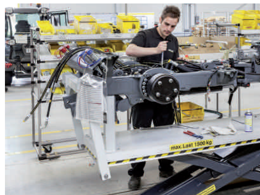
Nykonstruerad robust ram med integrerade hjulmotorer,