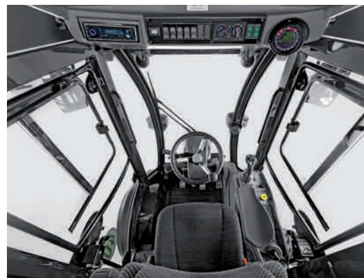
Funktions- och färgkodade reglage och mycket bra runtom sikt.

Våra rikstäckande auktoriserade verkstäder får fortlöpande utbildning för att ge dig sakkunnig guidning och bästa service. Det ger dig som användare trygghet och bästa driftsekonomi.