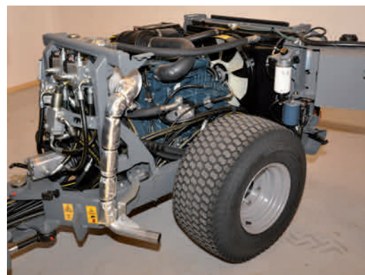
Lättillgänglig service och underhåll.