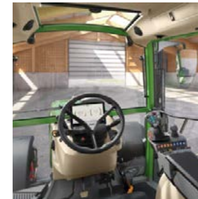
Profi Inställning 1