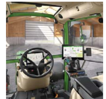
Profi+ Inställning 2