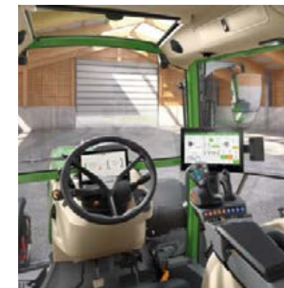
Profi Inställning 2