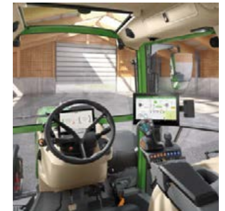
Profi+ Inställning 1