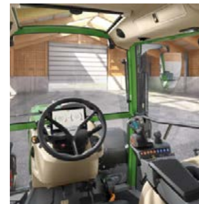
Power Inställning 2