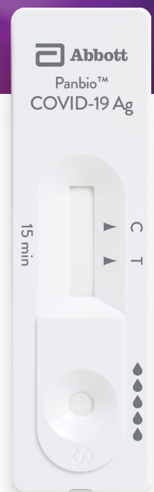
Panbio™ COVID-19 Ag Rapid Test Device